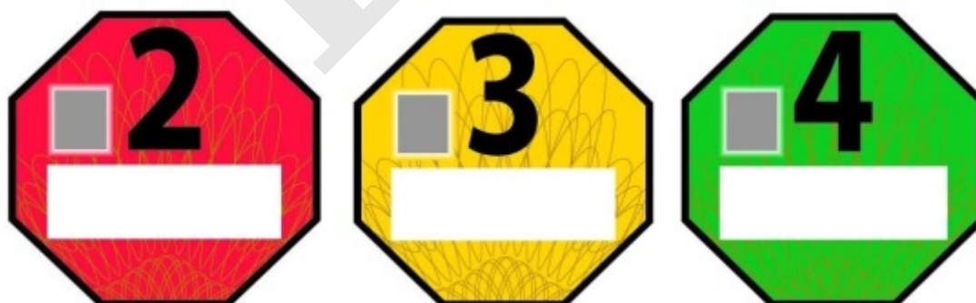
Obr. 2 - Vzory emisních plaket

Vzory emisních plaket jsou uvedeny v příloze č. 2 nařízení vlády č. 56/2013 Sb. , o stanovení pravidel pro zařazení silničních motorových vozidel do emisních kategorií a o emisních plaketách. Dle tohoto nařízení má emisní plaketa tvar osmiúhelníku o průměru kružnice vepsané 60 mm, viz obr. 2.